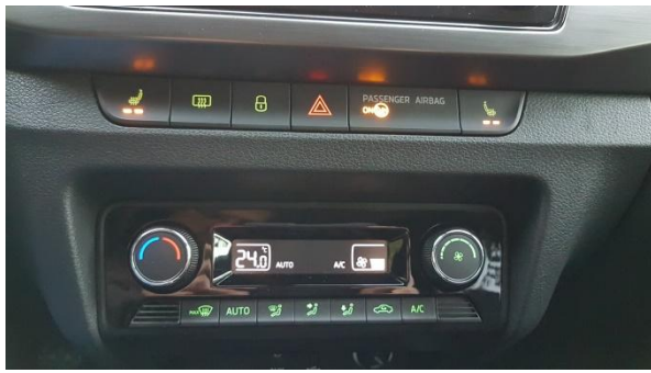
Obr. 1 tlačítková lišta na středový panel, verze s tlačítky pro vyhřívání sedadel